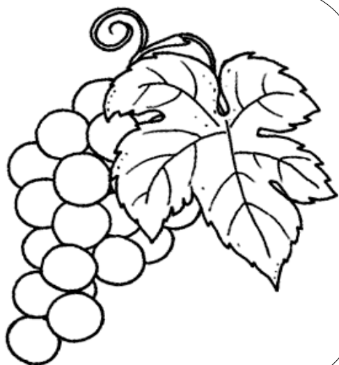
Il grappolo d'uva